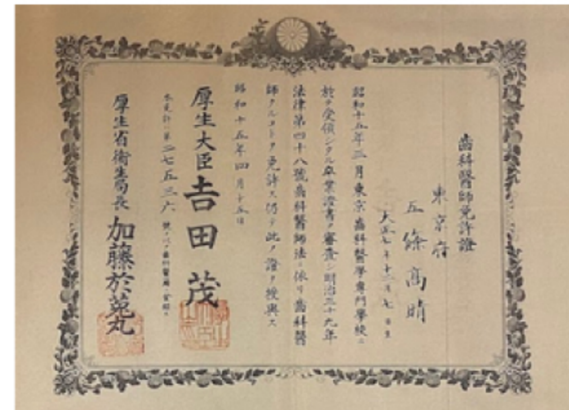
2代目高晴の歯科医師免許証 吉田茂厚生大臣に時代を感じます