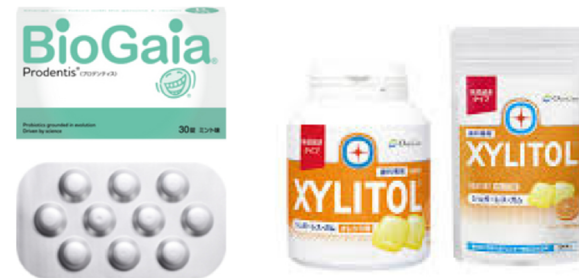
矯正装置や義歯にくっつきにくいガムベースを使用。市販品の2倍の固さで、咀嚼力を鍛えます。

十分な水分補給や室内の湿度管理が大切です。また、当院では口腔ケア製品として、バイオガイアおよびキシリトール100%ガムを取り扱っています。それぞれがドライマウスに効果的であり、口腔環境の改善に役立つとされています。